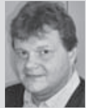
Dr. Jürgen Herzog

Hieran schließt sich die Thematisierung von Wertekonflikten bzw. von Dilemma-Situationen an, in denen verschiedene Werte des Vollzuges oder persönliche und vollzugliche Werte oder praktische Erfordernisse mit vollzuglichen Werten in Konflikt geraten. Häufig werden solche Konflikte von den Auszubildenden nicht als solche empfunden bzw. nicht als etwas Problematisches erlebt. Vielmehr werden pragmatische Lösungen gelebt, ohne dass die eigentliche Problematik bewusst wird. Daher ist es günstiger komplexere Dilemma-Situationen vorzugeben, denen man mit einfachen Lösungen nicht begegnen kann. Wichtig ist ebenfalls, dass diese Lösungen von den Anwärtern und Anwärterinnen eigenständig er-