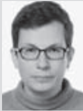
Dr. Stefan Suhling

und einer sozial wenig verantwortlichen Lebensführung in Zusammenhang stehen. Die Ziele des Strafvollzugs auf dieser Ebene lassen sich als Leistungsziele bezeichnen. Untersuchungen zur Wirksamkeit auf dieser Ebene haben