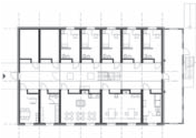
Konzeptbeispiel eines Geschosses

Der Spazier- und Entfluchtungshof rundet die Raumstruktur ab.